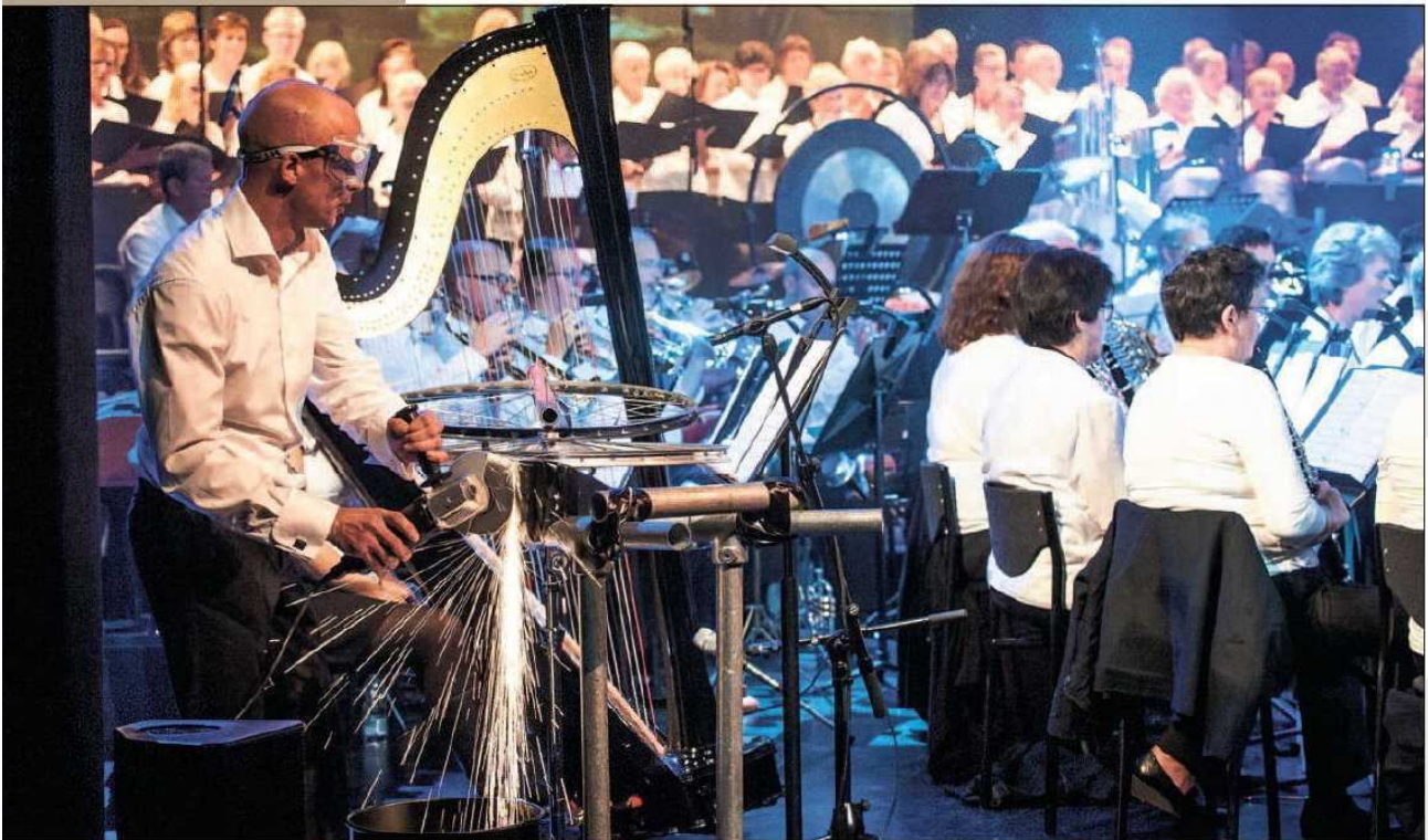
MUZIEKSPEKTAKEL HANGI LAUHA

Voor ons, muzikanten was het best spannend hoe de leerlingen dit zouden ervaren. We hebben hier achteraf veel enthousiaste reacties op gehad.